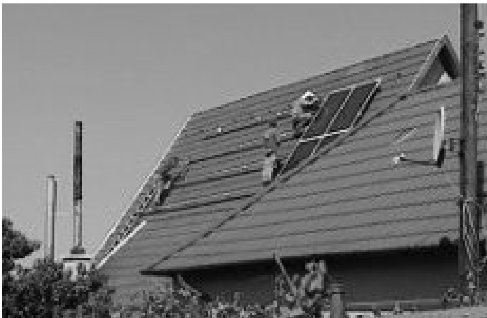
Napelemek a templomtetőn