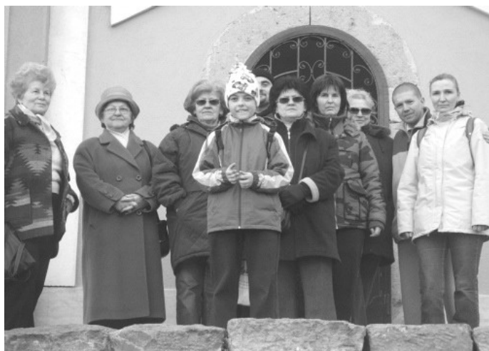
A kápolna bejárata előtt

A tavasz első napján a bibliaköri közösség szervezésében kis kirándulást tettünk a felsőgallai kálváriához és kápolnához. Megemlékeztünk a kis templom és a stációk történetéről, beszélgettünk a történelem tanulságai kapcsán korunk gyülekezeteiről, s – amint a képeken látható – megnéztük felülnézetből kis városunkat.