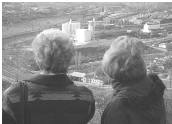
A város felett