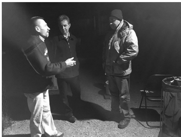
TESTVÉRI BESZÉLGETÉS AZ UDVARON

Nemcsak a téli hajléktalan ellátásban résztvevő önkénteseink, hanem jószívű közösségi tagjaink is részt vettek és segítettek a hagyományos karácsonyi ünnepen az USZSE menedékhelyén. Köszönjük a szívvel-lélekkel előkészített és hordozott estét nekik is, meg a „hivatásosoknak”, az USZSE munkatársainak is!