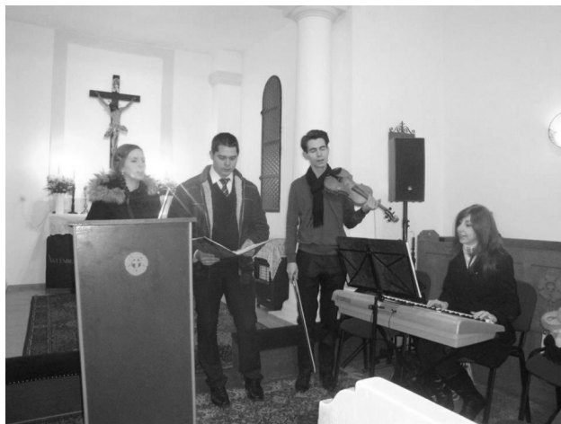
EVANGÉLIKUS TEMPLOM, REMÉNYSÉG GYÜLEKEZET